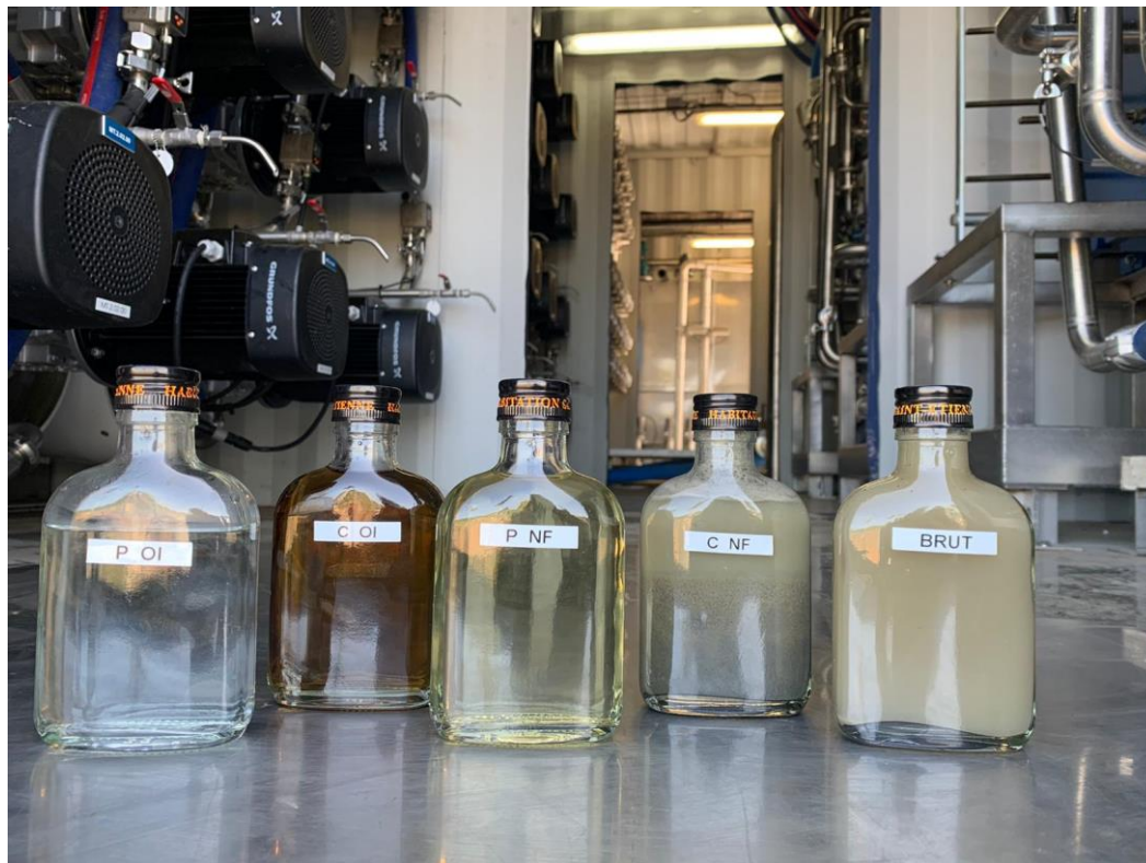
De la vinasse à l'eau pure – Plusieurs étapes de filtration

NEREUS sera présent du 12 au 15 octobre prochain sur le salon Pollutec à Lyon, le salon incontournable des solutions environnementales et énergétiques.